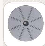
A - Disco