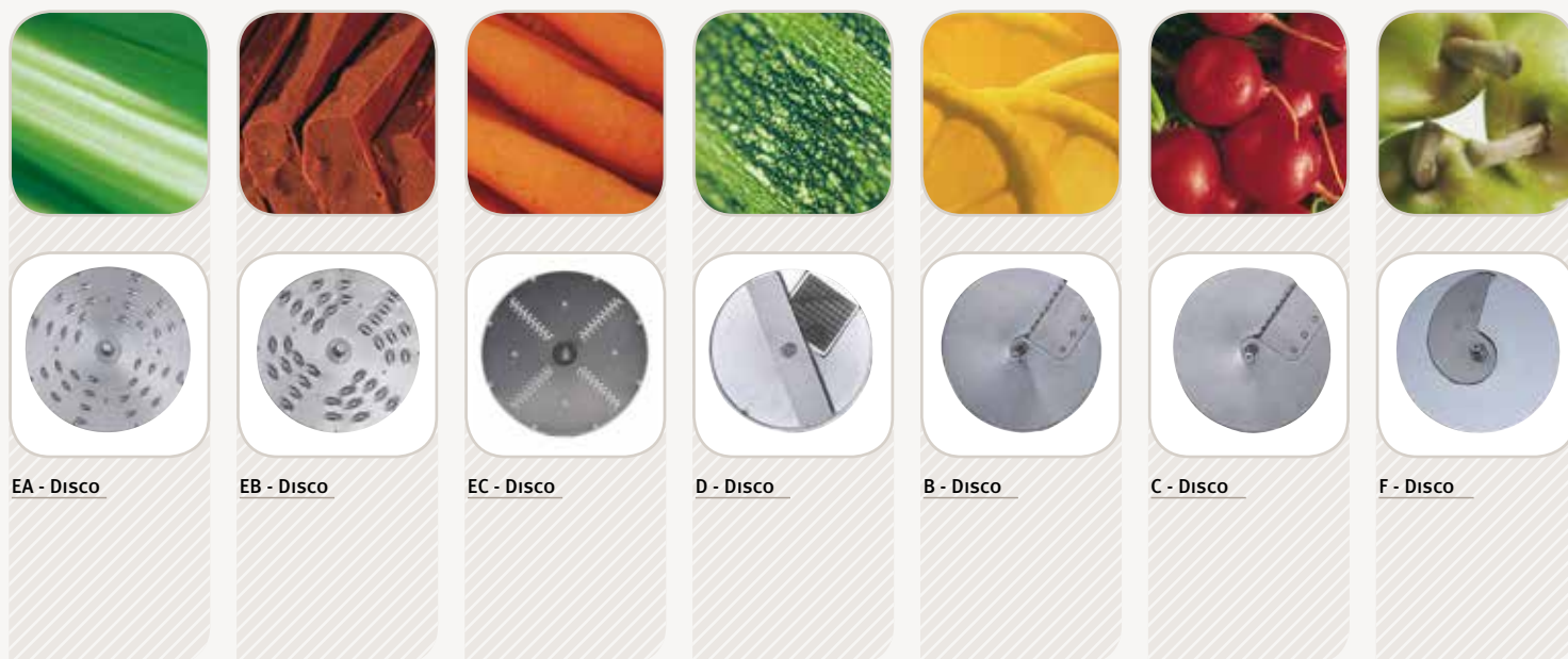
EA - Disco