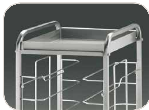
1470U + A050U